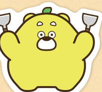
HITひろしま観光大使 ひろくま