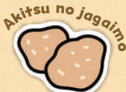
Akitsu no jagaimo