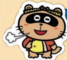
東広島市公認 マスコットキャラクター のん太