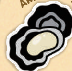
Akitsu no kaki